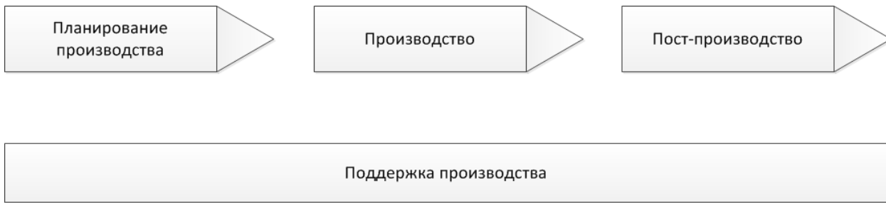
Рисунок 5 – Фазы производства