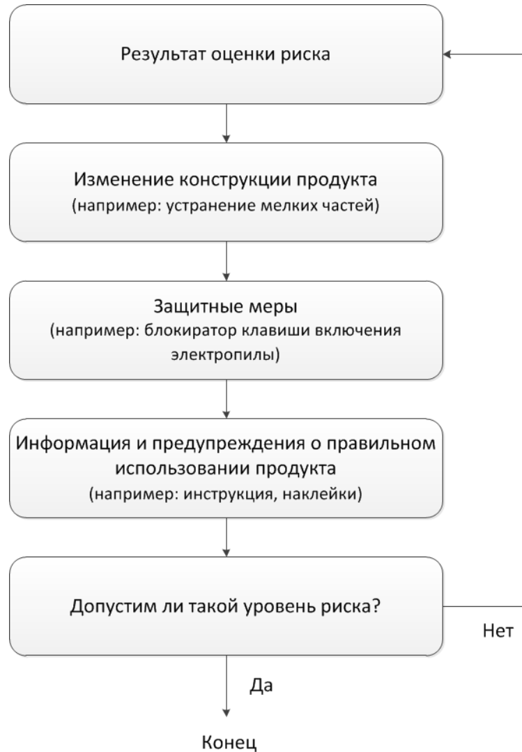
Рисунок 4 – Пример процесса снижения риска для организации

г) предоставление пользователям информации по безопасному использованию товара путем предоставления инструкций по эксплуатации, сборке и техническому обслуживанию и предупреждающих надписей, этикеток или наклеек.