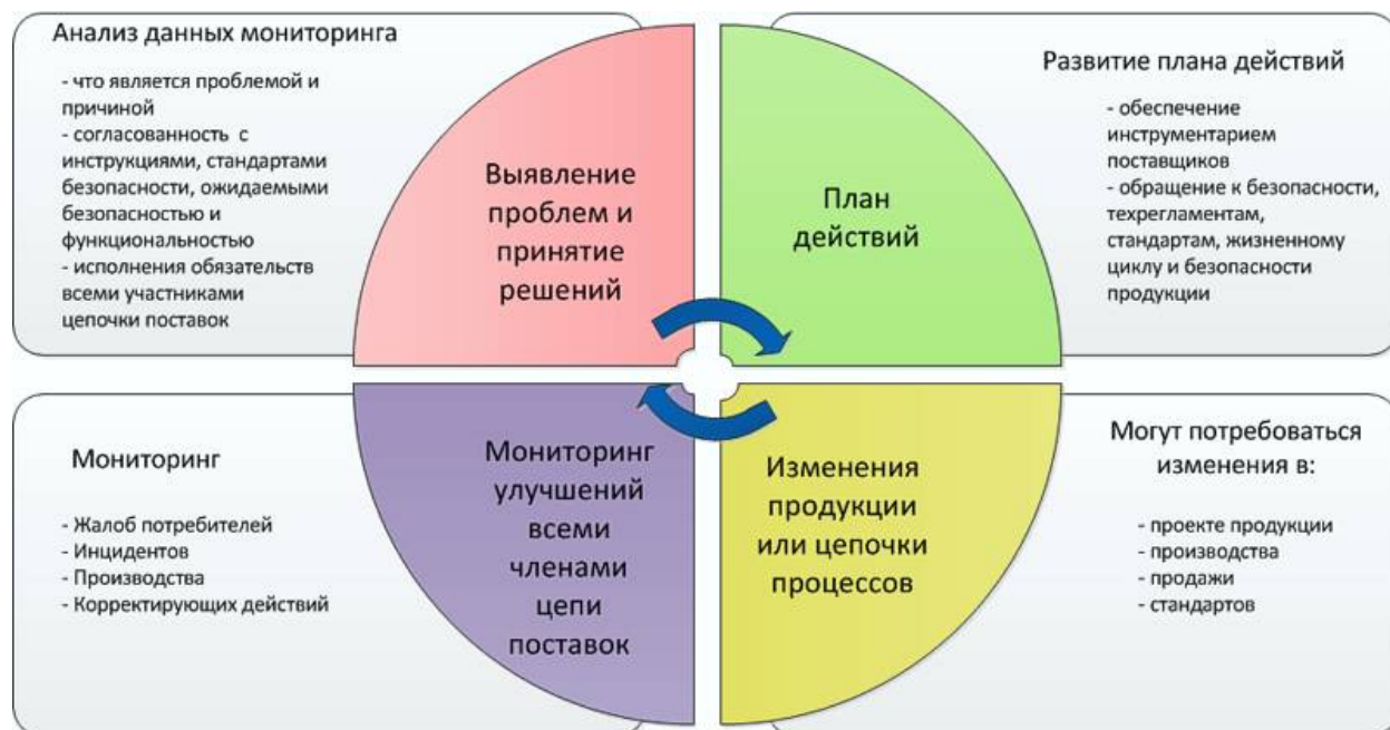
Рисунок 2 – Пример приближения к постоянному улучшению