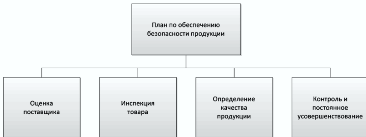
Рисунок В.1 — Схематическое представление плана по управлению безопасностью продукции, основанному на руководстве по обеспечению качества

На рисунке В.1 изображена схема плана управления безопасностью продукции на основе руководства по обеспечению качества.